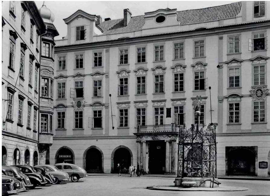
Obr. 8. Rychtrův dům, Praha 1 – Staré Město, Malé náměstí, průčelí. Foto: autor neznámý, 1941. Uloženo: Národní památkový ústav, generální ředitelství, sbírka fotografické dokumentace, inv. č. 153.608.