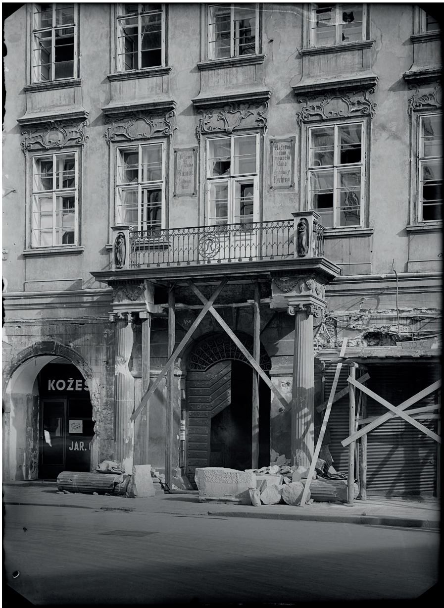
Obr. 9. Martinický palác (Richtrov dům), portál; poškozeno během Pražského povstání 5.–9. května 1945. Fotografie Ústavu dějin umění AV ČR, inv. č. S12375N, zpřístupněno v rámci projektu Sudek Project. Foto: Josef Sudek, 1945.

A dále pak toho, že Jan Muk necítil potřebu věnovat pozornost nejen podrobnějšímu popisu poslední dochované povrchové úpravy, ale ani starším barevnostem fasády, které bylo možné spojit s opravami domu v průběhu 19. a první poloviny 20. století. Nacházel se totiž z hlediska nálezové situace v daleko výhodnější pozici, než v jaké se nacházíme dnes my. Nakonec je třeba litovat také toho, že na místě nebyl odebrán a pro budoucnost uchován vzorek, který by dnes mohl být podroben detailní laboratorní analýze, jež by upřesnila stratigrafii, ale třeba také charakter použitých pigmentů a pojiv v jednotlivých vrstvách nátěrů. Mukova stručná zmínka o hráškové zeleni tak prozatím zůstává jedinou stopou po této barevnosti fasády Richtrova domu.