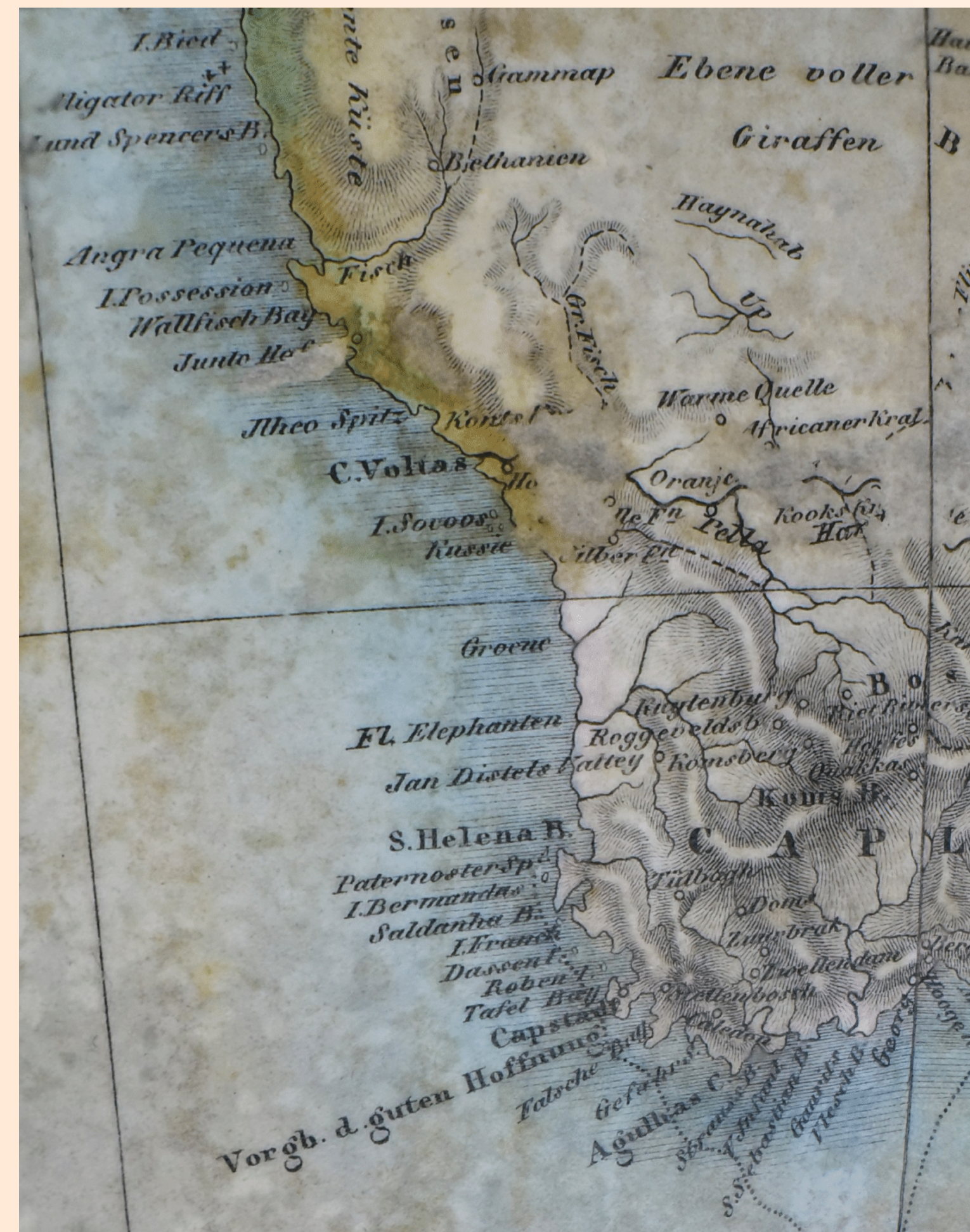
Obr. 4: Území Neznámé země