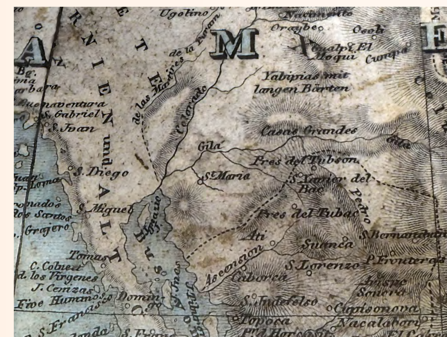
Obr. 5: Ukázka hraničních přerušovaných čar

Toponyma v Evropě (obr. 6) jsou tak přesycená, že jsou téměř nečitelná. Autor evidentně směřoval k úplnosti.