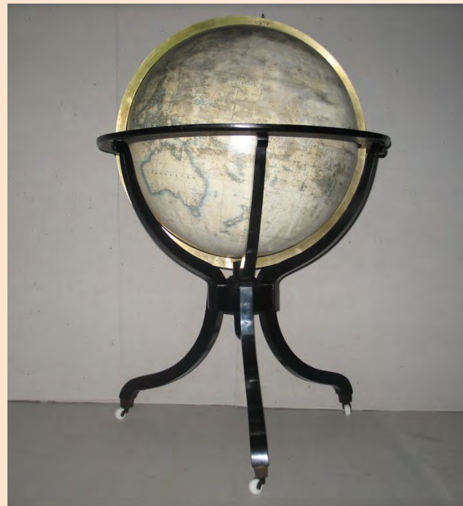
Obr. 1: Restaurovaný Jüttnerův glób z fondu Mapové sbírky PŘF UK

2 Mapová sbírka, Přírodovědecká fakulta, Univerzita Karlova