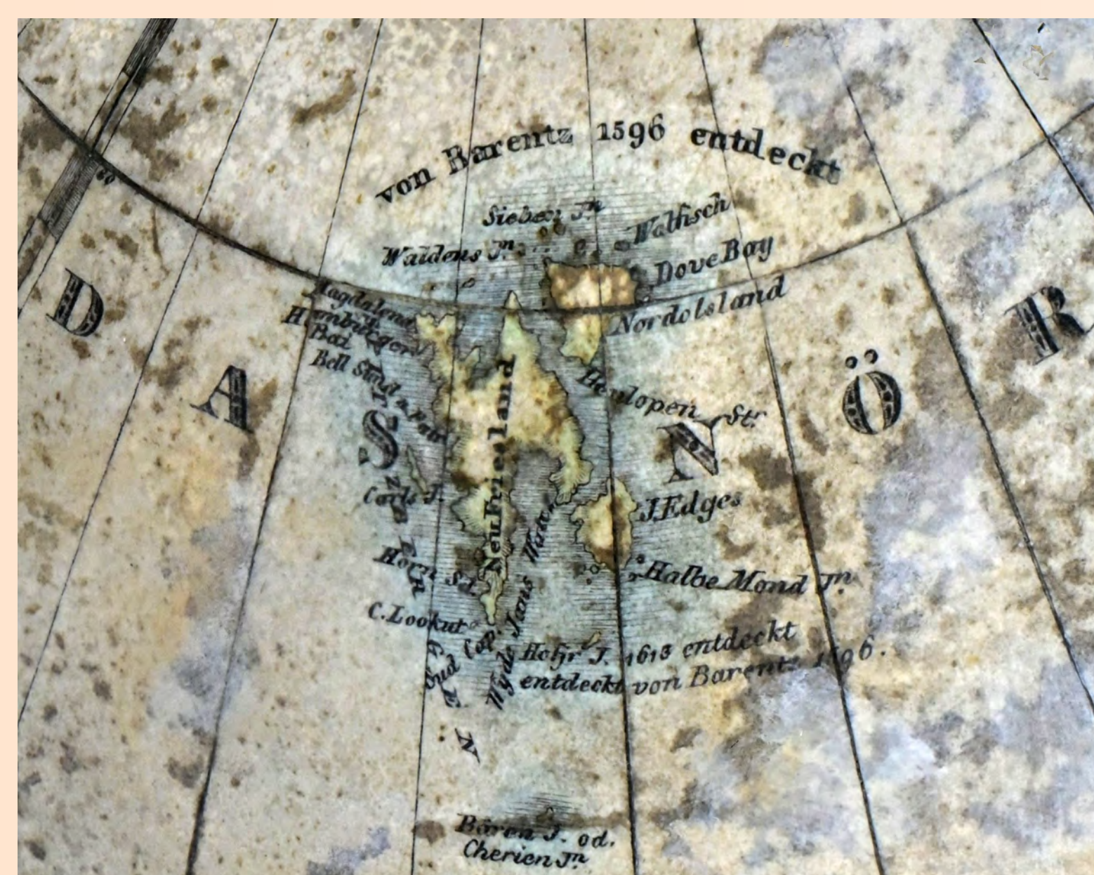
Obr. 3: Příklad zápisu zeměpisného objevu „von Barentz 1596 entdeckt“

von Barentz 1596 entdeckt (obr. 3), Neu Seeland von Abel Tasman entdeckt 1642, Neu Georgie. Entdeckt von Roche 1675, wieder aufgesucht von Cook 1775 u. Bellingshausen 1819.