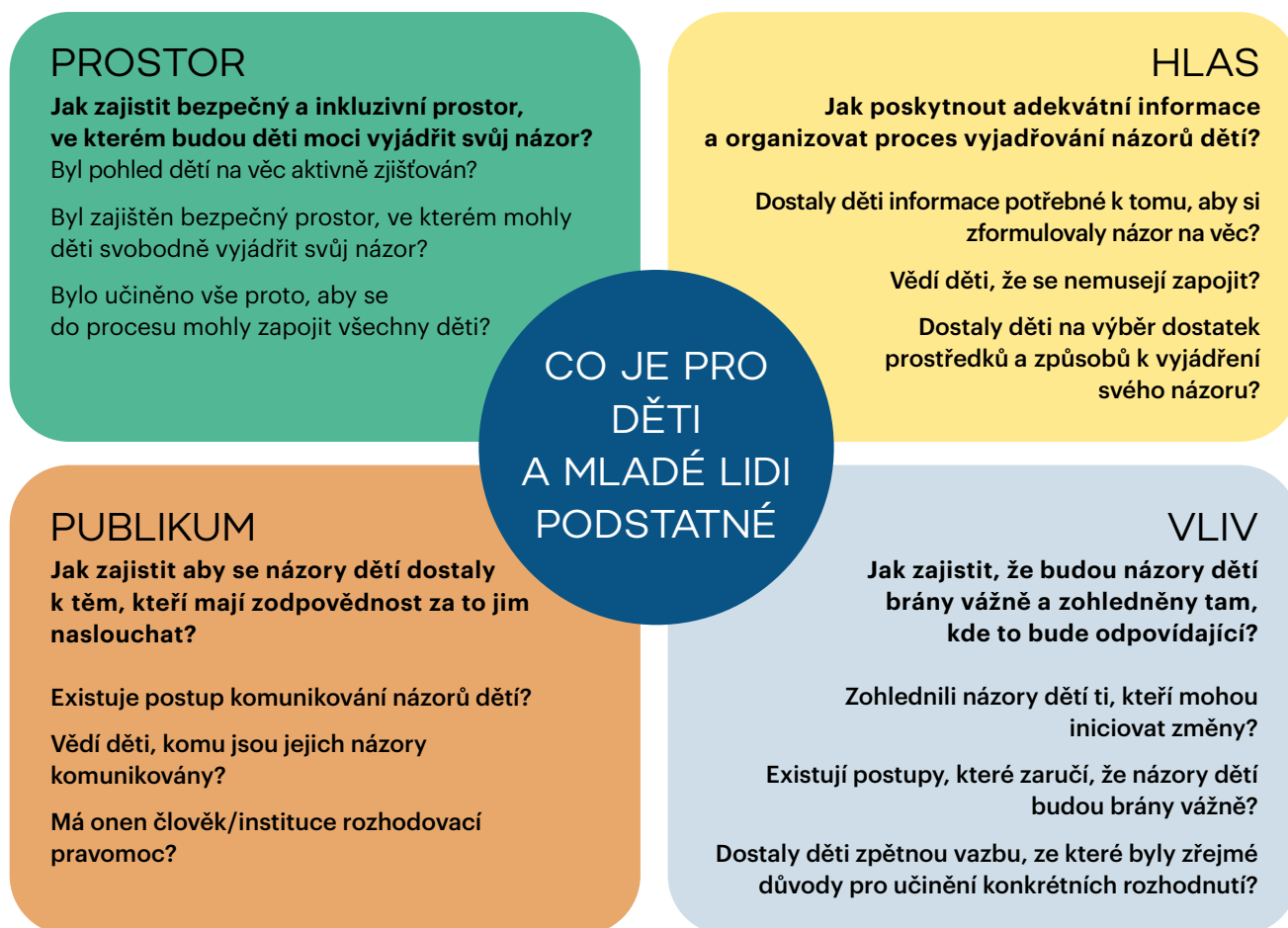
Obrázek 2: Model dětské participace Laury Lundy (2007).

komunita, např. třídní kolektiv). Podrobnější srovnání těchto dvou kategorizací viz (Dlouhá et al., 2021). Aby tyto kompetence mohly být účinně rozvíjeny, akční zkušenost musí být úspěšná – vést k zamýšlenému cíli. Ve škole je k tomu zapotřebí vytvořit vhodné prostředí, kdy názory dětí mají svou váhu a jejich akce jsou opravdovou zkušeností toho, jak se mohou zapojit do veřejného dění.